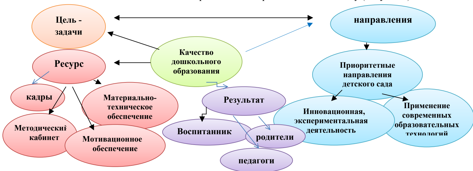
Рисунок 2 Модель методического сопровождения по приоритетному направлению

В детском саду сложилась система методической работы , позволяющая коллективу работать в режиме развития. Методическая работа ориентирована на достижение и поддержку высокого качества воспитательно - образовательной работы в детском саду (Рисунок 2)